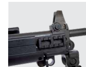
RIEL PICATINNY LATERAL