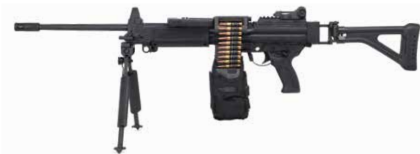
NEGEV 5,56 x 45 mm LMG Longitud del cañón de 460 mm

La NEGEV LMG es utilizada por la IDF. La NEGEV se dispara desde una posición de cerrojo abierto y se alimenta mediante cinturón de municiones, tambor de asalto o con un cargador OTAN.