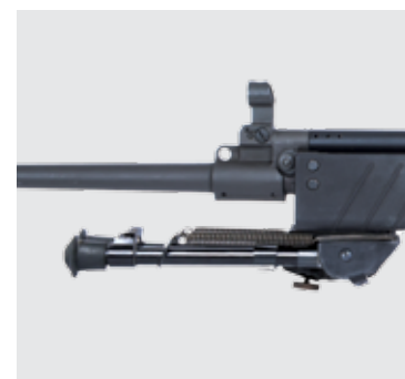
BÍPODE PLEGABLE Y AJUSTABLE