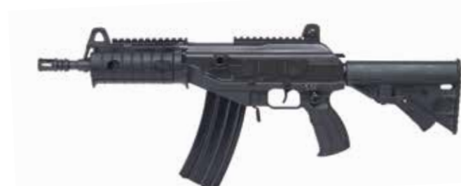
ACE 21 Fusil de asalto / Carabina de 5,56 x 45 mm Longitud del cañón de 216 mm