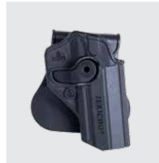
FUNDA DE LA PISTOLA