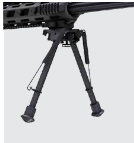
BÍPODE PLEGABLE Y AJUSTABLE