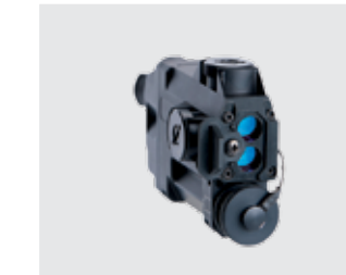
MEPRO STING puntero láser