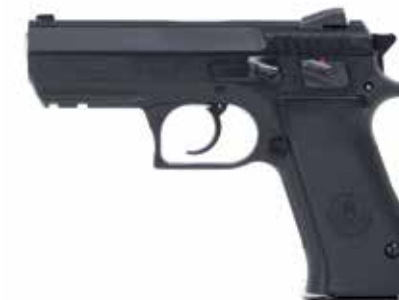
JERICO FS 9 x 19 mm / 0,40 S&W / 0,45 ACP longitud del cañón de 97 mm, seguro en el cuerpo del armazón