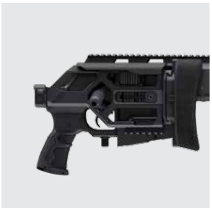
CULATA PLEGABLE LIVIANA CON LONGITUD DE EXTRACCIÓN AJUSTABLE