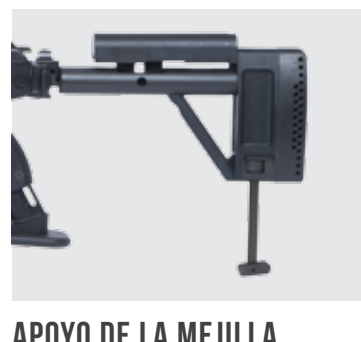
APOYO DE LA MEJILLA AJUSTABLE Y UNÍPODE DE CULATA AJUSTABLE