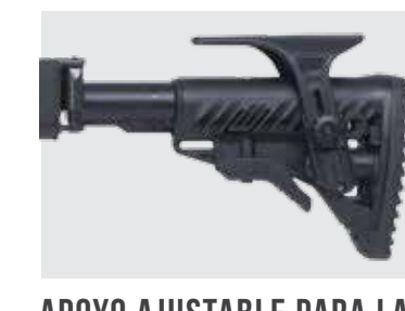
APOYO AJUSTABLE PARA LA MEJILLA