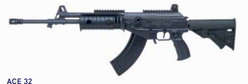
ACE 32 Fusil de asalto de 7,62 x 39 mm Longitud del cañón de 409 mm