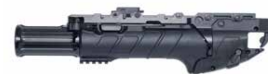
ACE IWI GL 40 Lanzagranadas de 40 x 46 mm Longitud del cañón de 305 mm

El IWI UBGL 40 está disponible en longitudes de cañón de 228,5 mm y 305 mm.