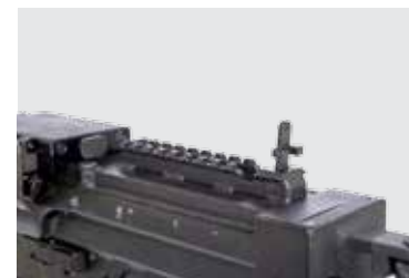
MIRA METALICA DE RESPALDO PLEGABLE