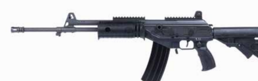
ACE 23 Fusil de asalto de 5,56 x 45 mm Longitud del cañón de 463 mm

PARA VER LOS ACCESORIOS OPCIONALES: VEA LA PÁG. 78