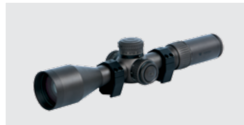
COMPATIBLE CON DIFERENTES TELESCOPIOS Aumento de hasta 27x