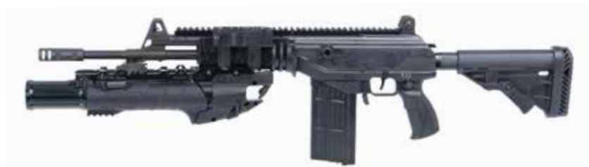
ACE 52 CON IWI UBGL Fusil de asalto Flattop de 7,62 x 51 mm con IWI de 40 mm UBGL