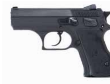
JERICO FB 9 x 19 mm / 0,40 S&W longitud del cañón de 89 mm, seguro en el cuerpo del armazón