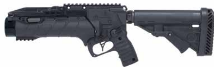
IWI GL 40 INDEPENDIENTE CORTO Lanzagranadas de 40 x 46 mm Longitud del cañón de 228,5 mm