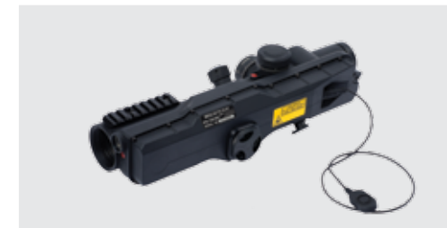
MEPRO MESLAS Control del disparo del francotirador Visor del fusil 10 x 40 con Telémetro Láser Completamente Integrado