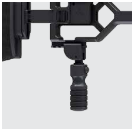
FOLDABLE & ADJUSTABLE MONO-POD