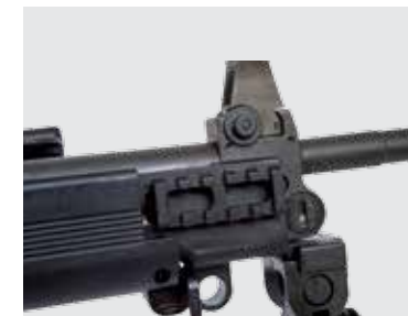
RIEL PICATINNY LATERAL