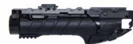
ACE IWI GL 40 CORTO Lanzagranadas de 40 x 46 mm Longitud del cañón de 228,5 mm