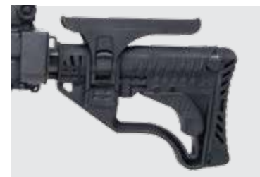
APOYO AJUSTABLE PARA LA MEJILLA