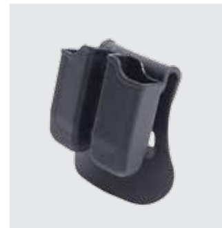
FUNDA DEL CARGADOR