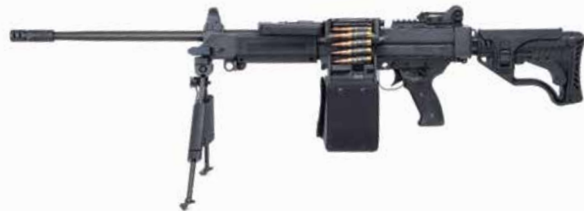
NEGEV NG-7 7,62 x 51 mm LMG Longitud del cañón de 508 mm

La NEGEV NG-7 se basa en la confiable NEGEV 5,56 LMG y es la única ametralladora liviana 7,62 x 51 mm con un modo semiautomático, lo que también le confiere un uso seguro en Combate en Espacios Cerrados (CQB). Se dispara desde una posición de cerrojo abierto y se alimenta mediante un tambor.