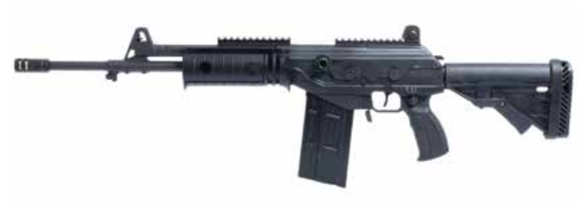
ACE 52 Fusil de asalto de 7,62 x 51 mm Longitud del cañón de 409 mm

Los modelos ACE 7,62 x 51 mm ofrecen la solución ideal, abarcando un arma moderna y confiable adecuada para objetivos a largas distancias en áreas abiertas y urbanas.