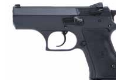
JERICO RB 9 x 19 mm / 0,40 S&W longitud del cañón de 89 mm, seguro en la corredera (decocker)