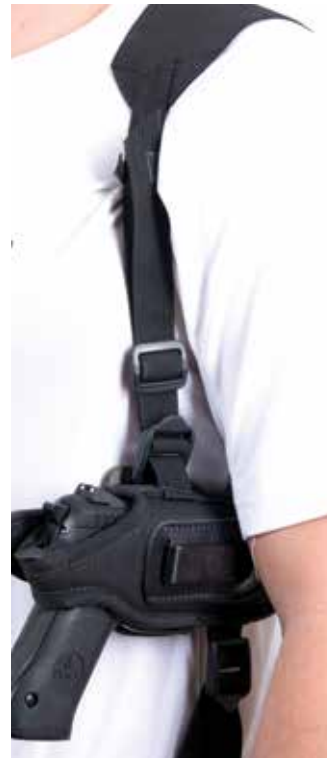
FUNDA PARA EL HOMBRO