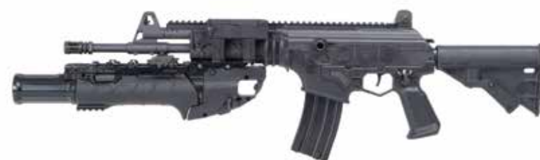
ACE-N 22 CON IWI UBGL Fusil de asalto Flattop de 5,56 x 45 mm con IWI de 40 mm UBGL