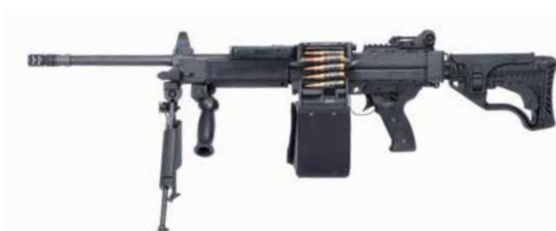
NEGEV NG-7 SF 7,62 x 51 mm LMG Longitud del cañón de 420 mm