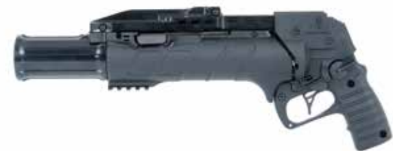
X95 IWI GL 40 Lanzagranadas de 40 x 46 mm Cañón de 305 mm

El IWI UBGL 40 está disponible en longitudes de cañón de 228,5 mm y 305 mm.