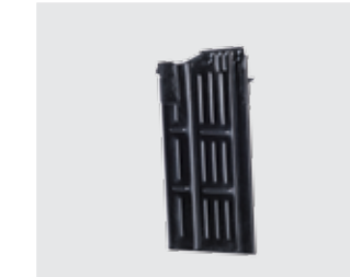
CARGADOR 10 / 25 cartuchos