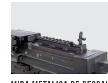
MIRA METALICA DE RESPALDO PLEGABLE