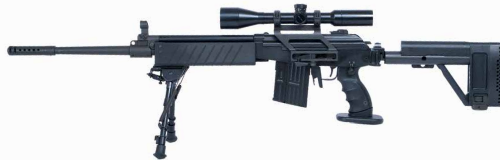
GALIL SNIPER S.A. 7,62 x 51 mm con telescopio de día de 10x