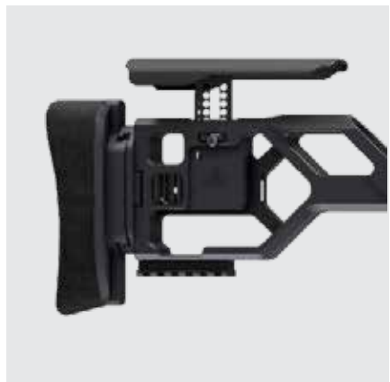
APOYO AJUSTABLE PARA LA MEJILLA