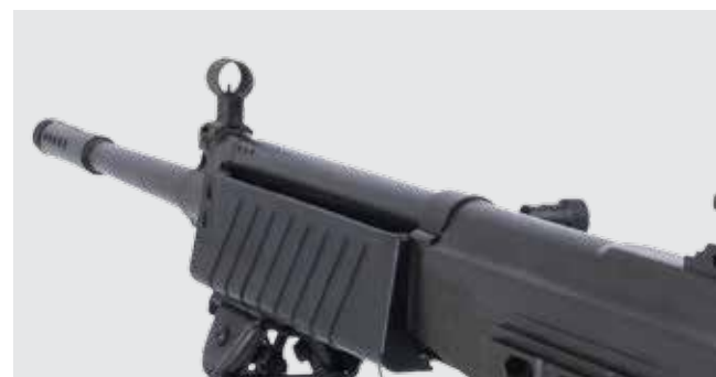
MIRAS DE RESPALDO TRASERA Y DELANTERA