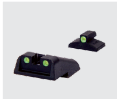
MIRA DE TRITIO Mira de tritio auto iluminada