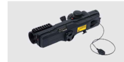
MEPRO MESLAS Control del disparo del francotirador Visor del fusil 10 x 40 con Telémetro Láser Completamente Integrado