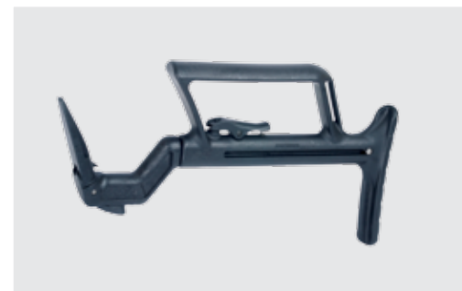
CULATA PLEGABLE (Únicamente en modelos poliméricos)