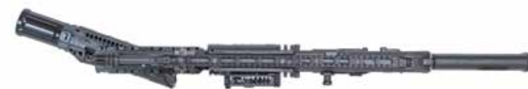
CAÑÓN DE APERTURA LATERAL (VISTA SUPERIOR)