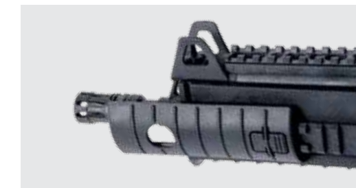
EMPUÑADURA REMOVIBLE CON RIELES PICATINNY (AMBOS LADOS)