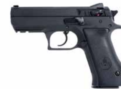
JERICO RS 9 X 19 mm, 0,40 S&W / 0,45 ACP longitud del cañón de 97 mm, seguro en la corredera (decocker)