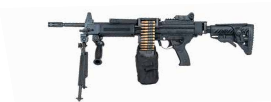
NEGEV SF 5,56 x 45 mm LMG Longitud del cañón de 330 mm