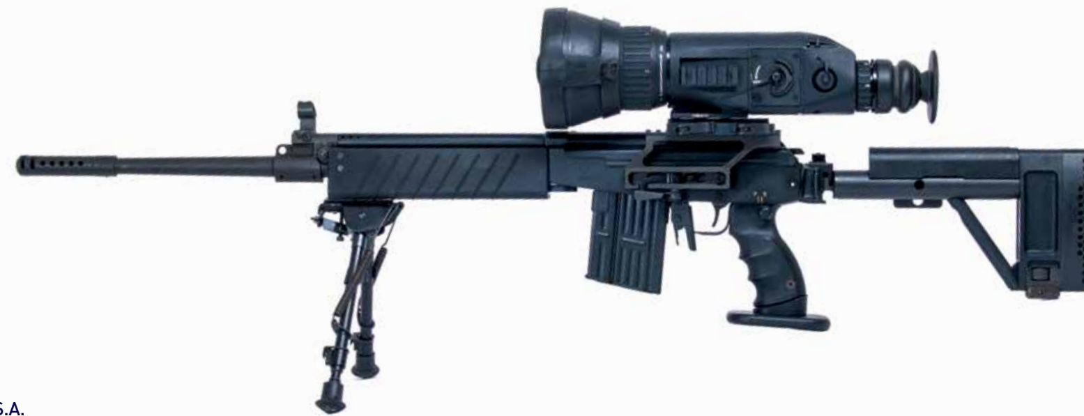
GALIL SNIPER S.A. 7,62 x 51 mm con MEPRO NOA 7X mira térmica sin refrigeración con aumento de 7x