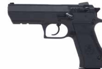
JERICO R 9 x 19 mm / 0,40 S&W longitud del cañón de 112 mm, seguro en la corredera (decocker)