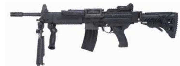
NEGEV SF 5,56 X 45 mm LMG con longitud del cañón de 330 mm Adecuado con el cargador OTAN de 5,56 x 45 mm