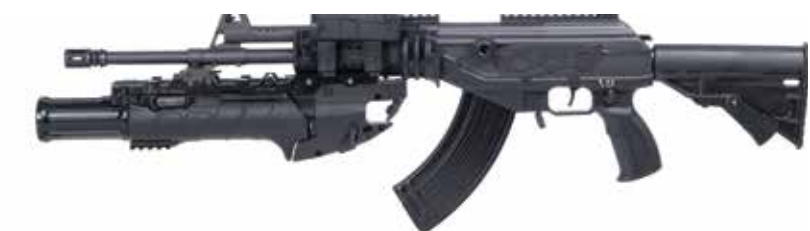
ACE 32 CON IWI UBGL Fusil de asalto de 7,62 x 39 mm con IWI de 40 mm UBGL