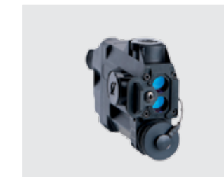
MEPRO STING Puntero láser