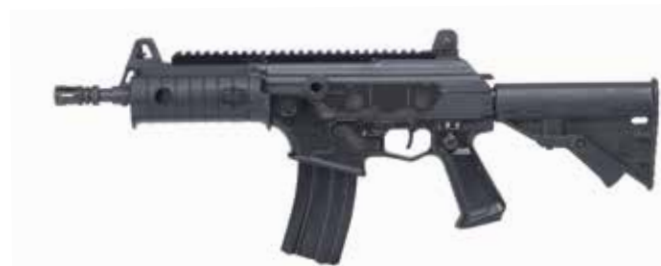
ACE-N 21 Fusil de asalto / Carabina Flattop de 5,56 x 45 mm Longitud del cañón de 216 mm