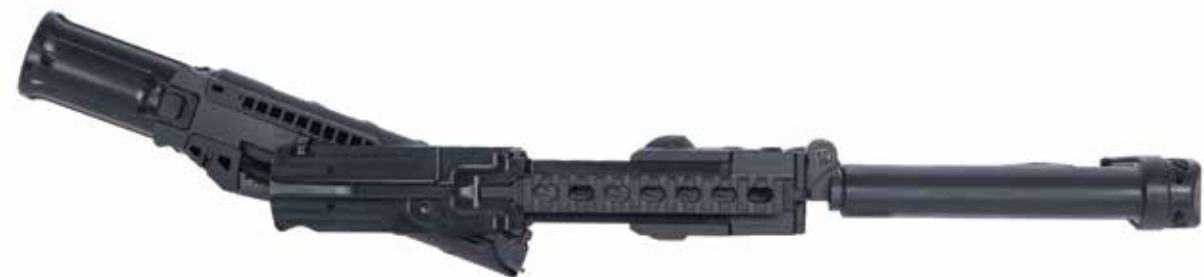
CAÑÓN DE APERTURA LATERAL (VISTA SUPERIOR)