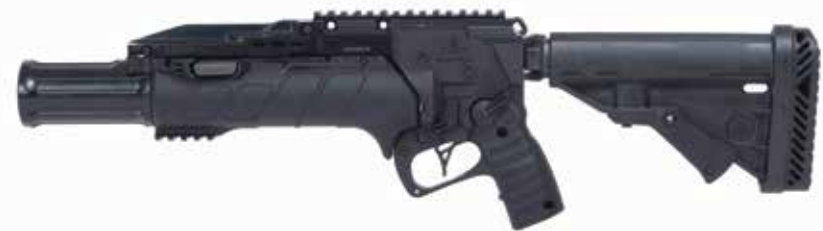
IWI GL 40 INDEPENDIENTE Lanzagranadas de 40 x 46 mm Longitud del cañón de 305 mm

El IWI GL 40 Independiente está disponible en longitudes de cañón de 228,5 mm y 305 mm.