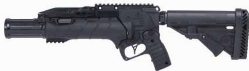
IWI GL 40 INDEPENDIENTE Lanzagranadas de 40 x 46 mm Longitud del cañón de 228,5 mm o 305 mm