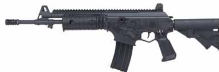
ACE-N 22 Fusil de asalto Flattop de 5,56 x 45 mm Longitud del cañón de 335 mm