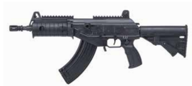
ACE 31 Fusil de asalto de 7,62 x 39 mm Longitud del cañón de 216 mm

Los modelos ACE 7,62 x 39 mm ofrecen la solución ideal para muchas fuerzas militares en todo el mundo que tienden a reemplazar sus armas con modelos modernos, innovadores y de alto desempeño sin tener que cambiar sus municiones y cargadores.