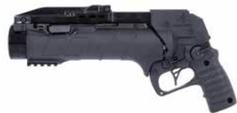
X95 IWI GL 40 CORTO Lanzagranadas de 40 x 46 mm Cañón de 228,5 mm