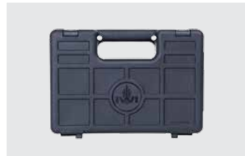
ESTUCHE DE POLÍMERO