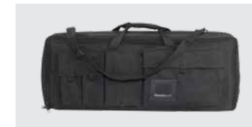
ESTUCHE DE TRANSPORTE TÁCTICO (incluye protector para el francotirador)