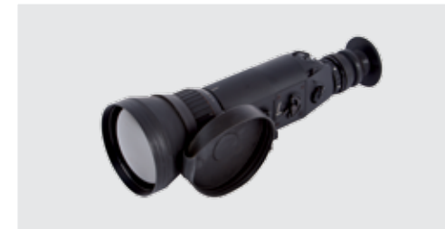
MEPRO NOA 7X Mira térmica Sin refrigeración con aumento de 7x