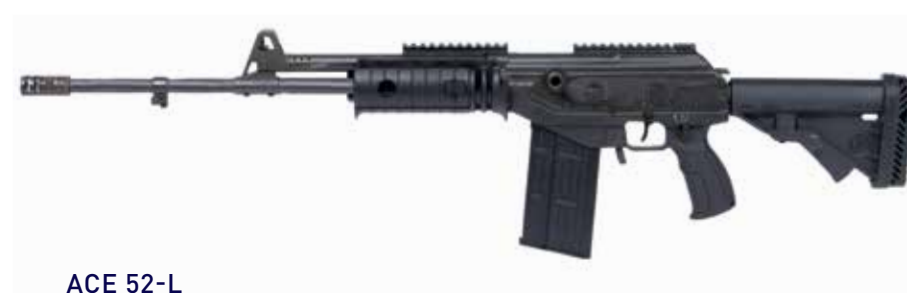
ACE 52-L Fusil de asalto de 7,62 x 51 mm Longitud del cañón de 511 mm