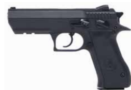
JERICO F 9 x 19 mm / 0,40 S&W longitud del cañón de 112 mm, seguro en el cuerpo del armazón