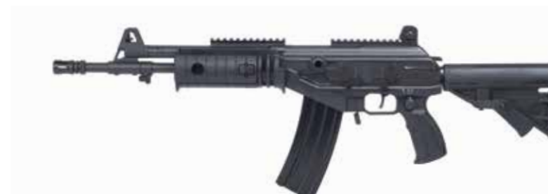
ACE 22 Fusil de asalto de 5,56 x 45 mm Longitud del cañón de 335 mm