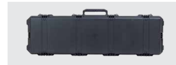
ESTUCHE DE TRANSPORTE TÁCTICO